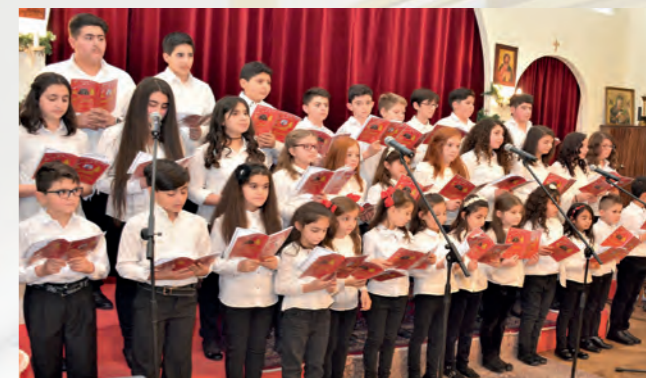
Kinder- und Jugendchor